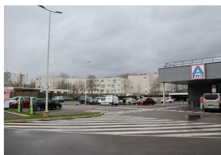
PARKING D'ALDI rue d'Alentour