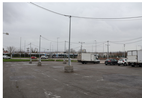
PARKING DU MARCHÉ Avenue de Poissy

Parkings mis à disposition des habitants POUR LE 8 MARS :