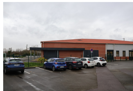
PARKINGS DE LA MAISON MUNICIPALE DES JEUNE L'ENVOL & RESTO' DU CŒUR 52/54 rue d'Andrézy

Attention cet emplacement de repli est sur le tracé de la course. Si vous stationnez sur ce parking, vous n'aurez pas la possibilité d'en sortir avant 18h, ce dimanche 8 mars.