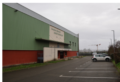
PARKING DU COMPLEXE SPORTIF DAVID DOUILLET rue d'Alentour

Attention cet emplacement de repli est sur le tracé de la course. Si vous stationnez sur ce parking, vous n'aurez pas la possibilité d'en sortir avant 18h, ce dimanche 8 mars.