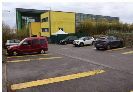
PARKING DU COMPLEXE LAURA FLESSSEL + PLATEAU FLESSSEL Mail du Coteau