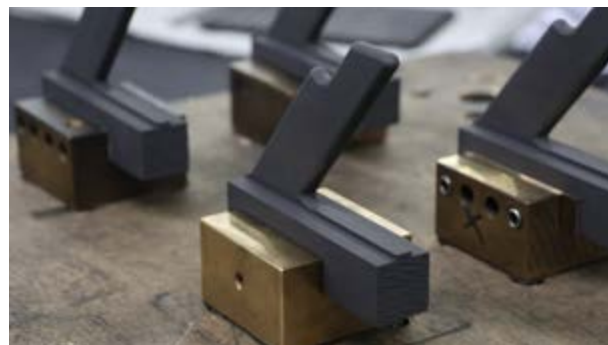
Ci-dessus : une électrode fabriquée par Outil Précis, utilisée pour l'usinage de formes complexes dans les matériaux.