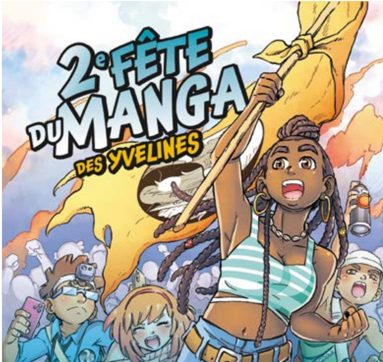
Illustration : Loui, conception graphique : Carine Simon pour Mémoire et BD.

Le mercredi 19 février , de 14h à 18h, Chanteloup-les-Vignes accueillera la 2 e édition de la Fête du Manga des Yvelines. Organisé à l'Espace Culturel Paul-Gauguin et à l'AVEC, cet événement gratuit invite les passionnés et curieux de culture japonaise à vivre un après-midi riche en découvertes, échanges et créativité.