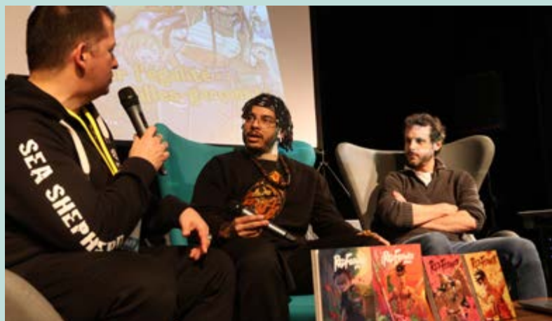
Rencontres et dédicaces Les visiteurs ont pu échanger avec les mangakas et suivre un débat autour de leurs œuvres.

Concert dessiné Autre moment fort de la journée : le concert dessiné en live avec le Paname Symphony Orchestra. Une expérience artistique et musicale unique où deux dessinateurs ont créé des œuvres en direct, projetées sur écran géant, accompagnées par la musique envoûtante de l'orchestre.