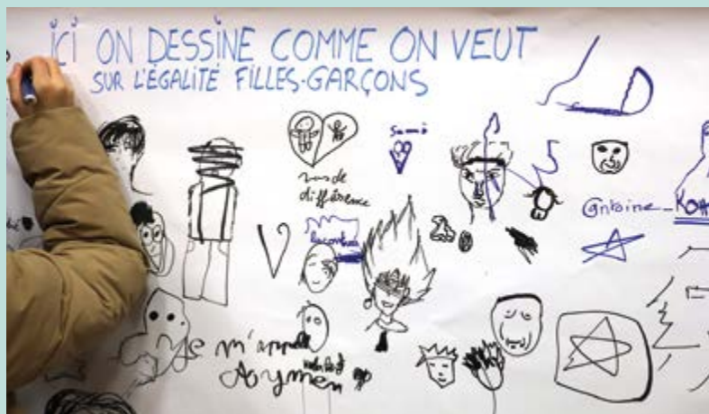
Fresque géante Un espace d'expression libre où chacun a pu dessiner et écrire autour du thème de l'égalité filles-garçons.