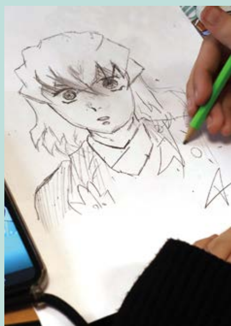
Ateliers de dessin L'AVEC a proposé toute l'après-midi des ateliers pour apprendre les bases du dessin de personnages.

En point d'orgue de cette édition, les jeunes participants ont eu le privilège de repartir avec un exemplaire du manga "Yin Yang Théorie", une œuvre collective signée par 11 artistes, spécialement créée pour célébrer l'égalité filles-garçons.