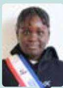
Deinyaba NIASS CM1 • Mille visages