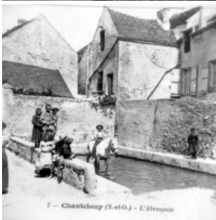
7 - Chanteloup (S-et-O.) - L'Arrière