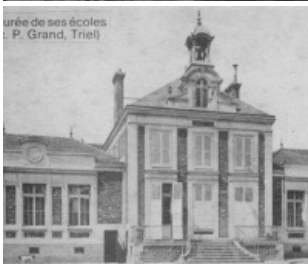
6 - Chanteloup (S-et-O.) - La Mairie et les Écoles