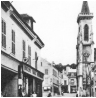
5 - Chanteloup (S-et-O.) Grande-Rue - Paroisse de l'Église